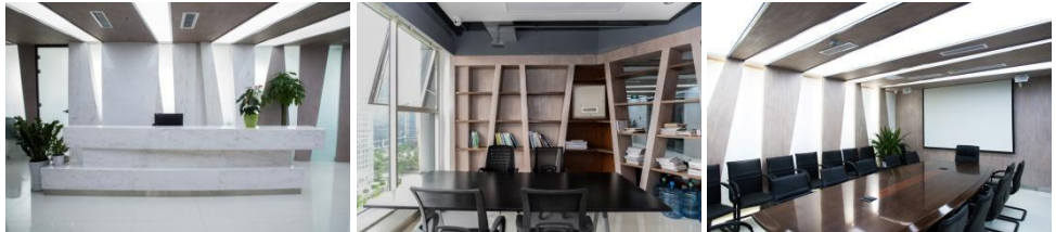
Heng Tai Office Design (built)