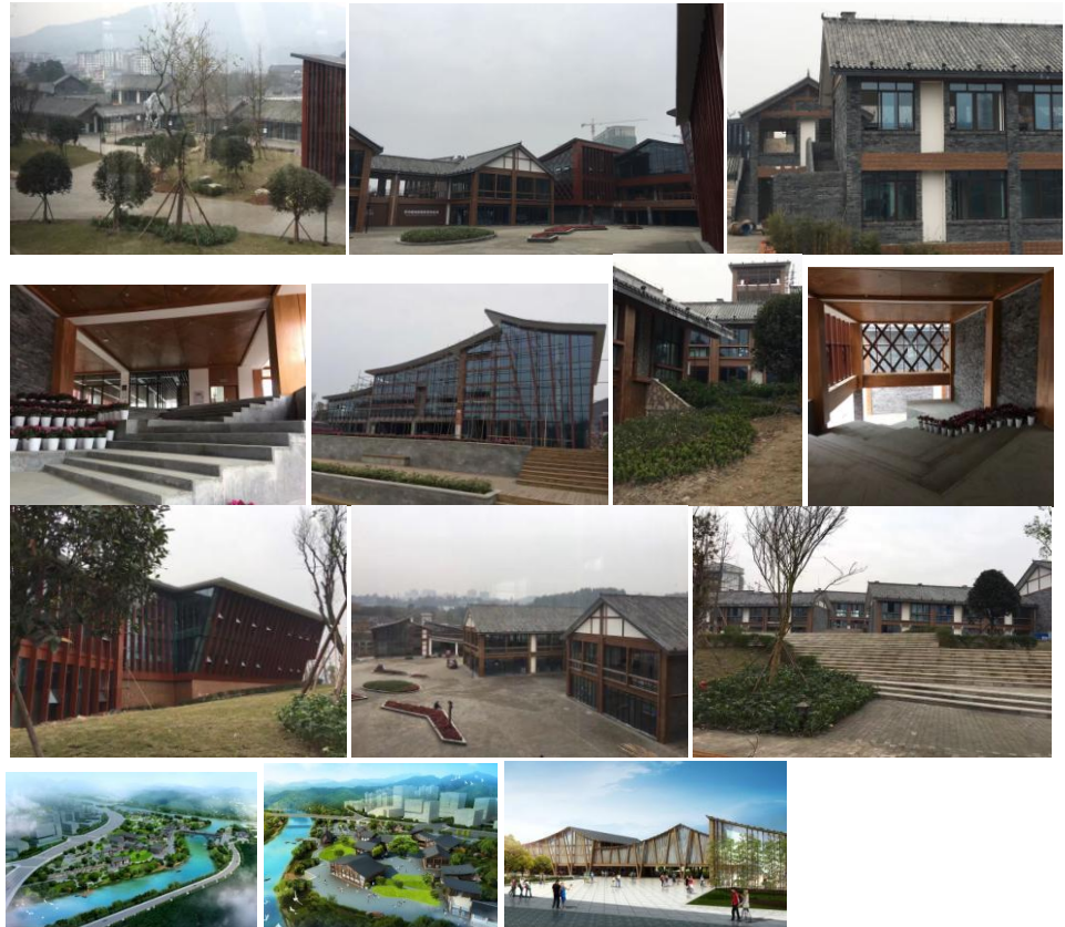
Enyang Ancient Town (built)