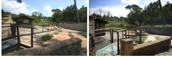
Italy CAVE Piazza Santo Stefano (built)