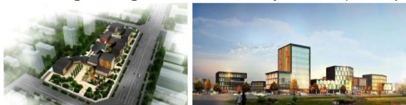
Nanchong Management Centre Project One (in the process)